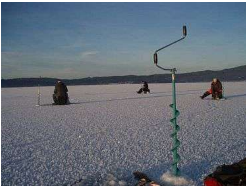
Fra Steinsfjorden

Litt tidlig å tenke på ? Nei. Spør du de ihuga isfiskerne i klubben, som det er en del av, så er det dette de venter på gjennom den lange sommeren ! Vi har etter hvert fått et godt og aktivt isfiskemiljø i foreningen og turene / konkurransene er mange. Været avgjør mye om tid, sted. Derfor tas aktivitetene litt på sparket. Vil du være med er det lurt å følge med på nettet og isfiske-sidene til Harald Hovde. Bli med du også ! Jarenvannet og Steinsfjorden er populære mål.