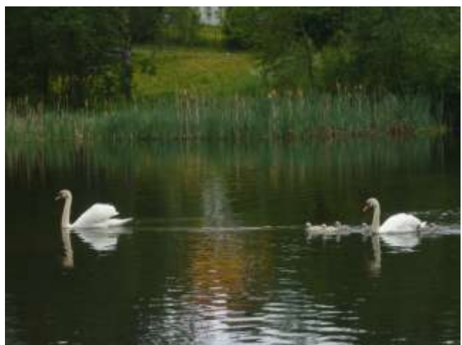
Svanene på dammen