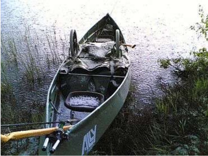
Kano full av hagl