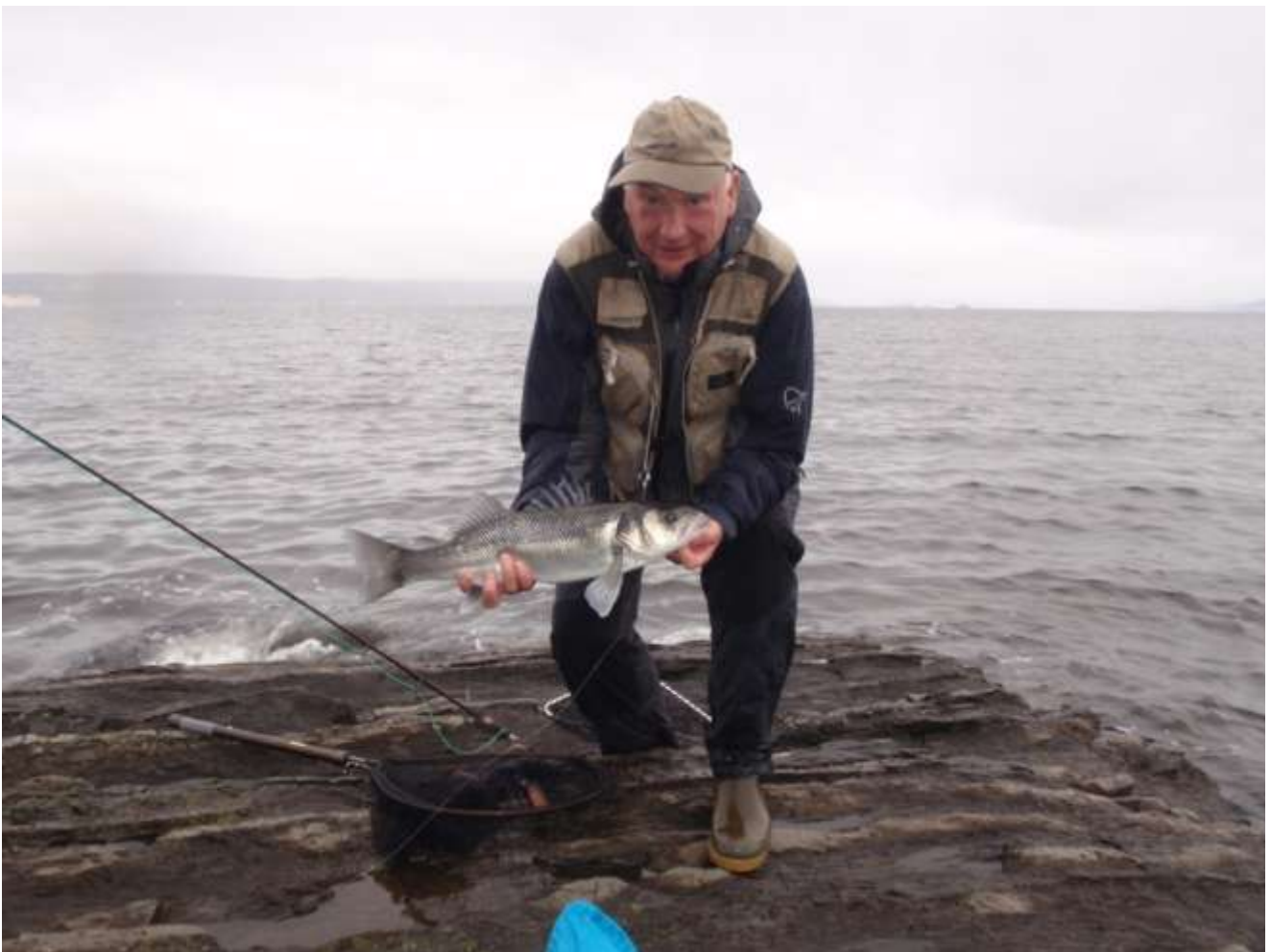
Formannen med en 2-kilos havabbor tatt på Langåra i september