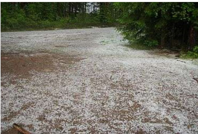
Slik så veien ut da trilleturen til Hakadal startet.