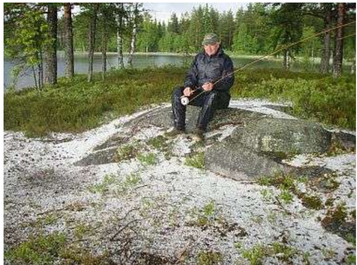
Ivrig fluefisker sitter i snøhaugen og speider etter vak.