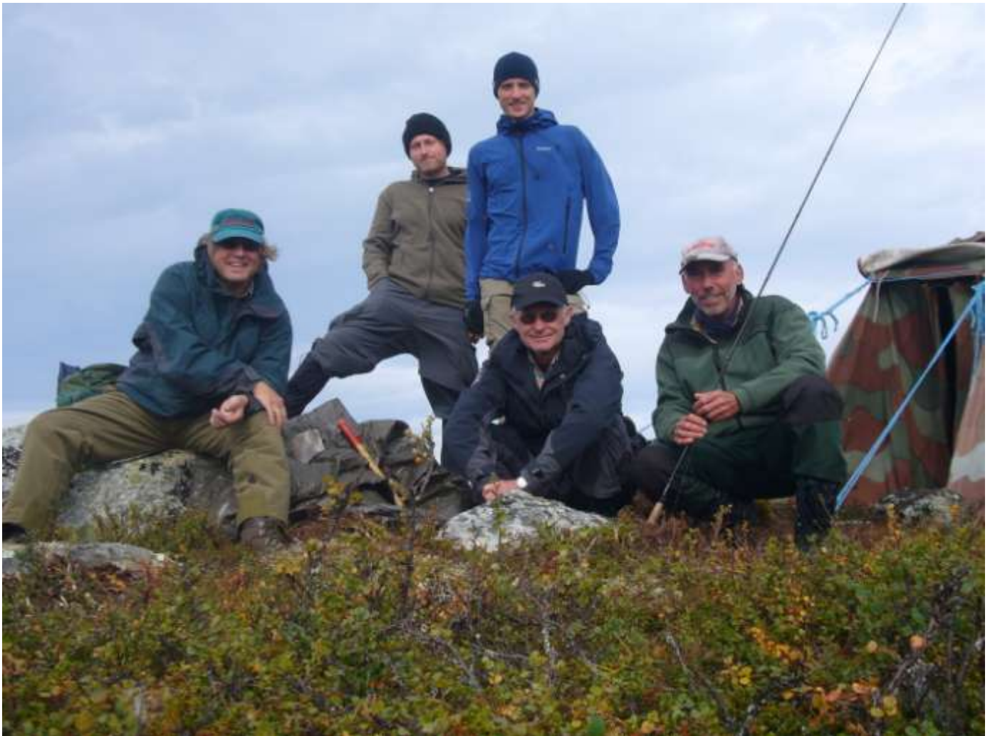
Gutta på Hardangervidda