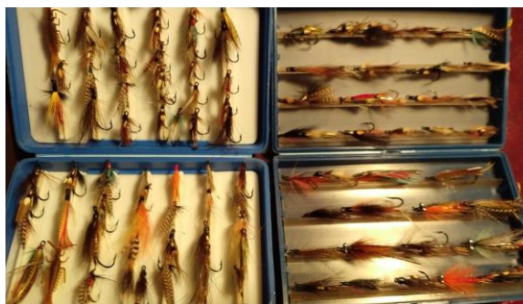
Flueboks med diverse