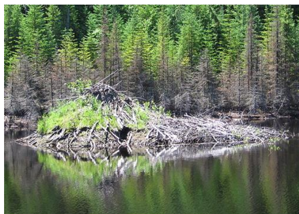
En annen større beverhytte

Stilheten brytes av et voldsomt plask i det fisken velter seg i overflaten.. - flua mi? Etter et nølende sekund setter jeg allikevel et tilslag og kjenner motstand. Tung motstand. Langt der ute går den og stanger før den lot taue inn på uforventet medgjørlig vis. Men så enkelt skulle det ikke bli. Da en kom under stang-tuppen fikk den antagelig øye på meg og satte fart inn under beverhytta. På motsatt side av meg.