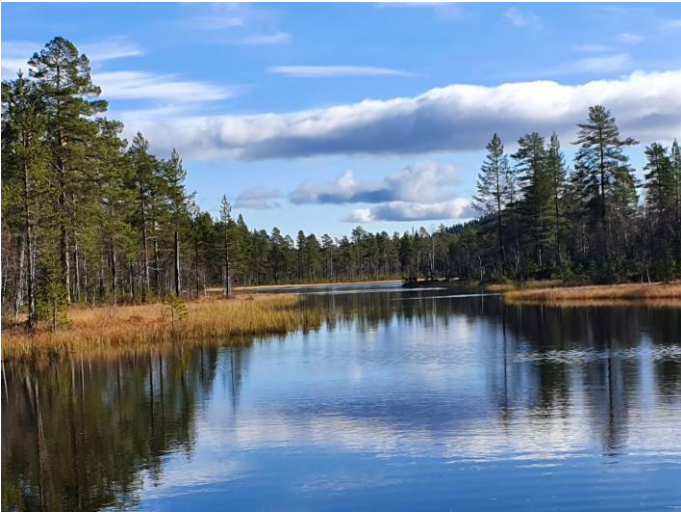
Til høyre» kanalen» - særdeles vannrik i slutten av oktober i år