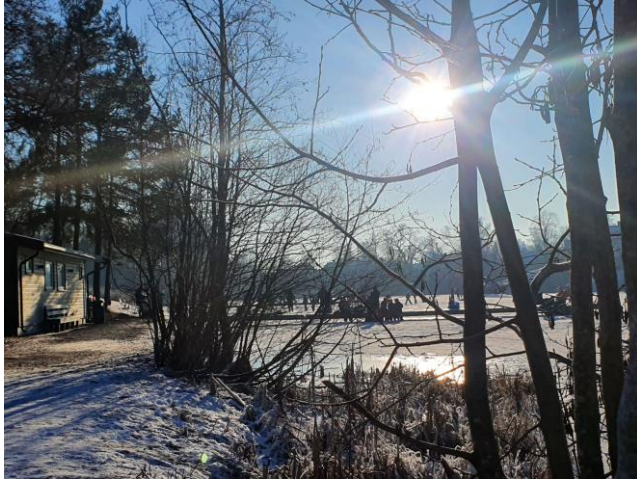
Til venstre Holmendammen i vinterskrud og mange folk på isen med skøyter !

Her passer det vel med et par fine bilder fra vinterlige Holmendammen og høstlige «Kanalen» ved Veslefåtan. Og vi er bare 3 måneder unna ny sesong i marka. Vi gleder oss til sommerlige opplevelser også, kanskje ved Gamledammen i Mistra.