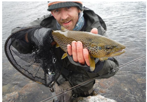
En annen fisk et annet år på Hardangervidda.

Mange fisker husker man fordi fangstopplevelsen var stor, og denne er nok absolutt en av dem. Men denne var også en av de vakreste ørretene jeg har sett. På en kald januardag kan jeg lukke øynene og nyte synet av den fisken.