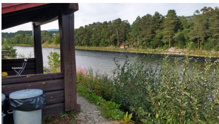
Et par av rekreasjonsinnretningene nær elven