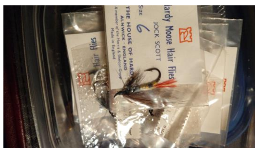
Div. Hardy fluer