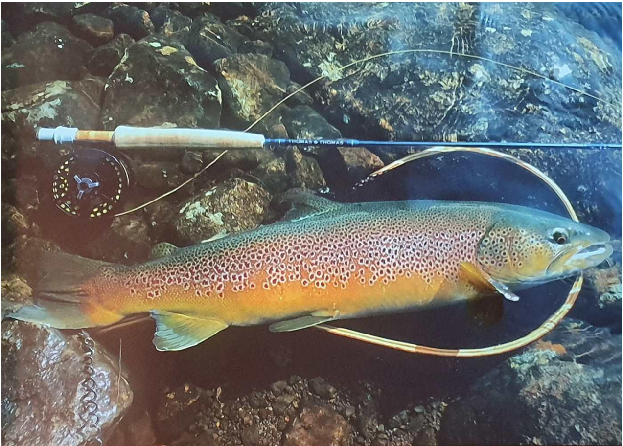
Et prakteksemplar av en ørret fra Hardangervidda