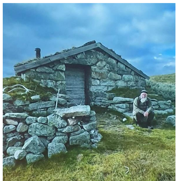
Svein i robust husvære på Vidda

I senere tid er vel Tore Qvenilds bok fra 2004 et must for å få en god forståelse både om historien og fiskeplasser (reds kommentar).